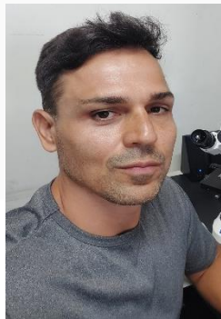
Francisco Júnior Odontologia UFPE/PE