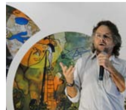
Francisco Batista Júnior, Presidente do CNS

Após a realização de 359 conferências municipais, 204 conferências regionais e 27 conferências estaduais de saúde mental com o envolvimento de 46 mil pessoas de todo o País, foi realizada, entre 27 de junho e 01 de julho, em Brasília, a etapa nacional da IV Conferência Nacional de Saúde Mental - Intersetorial (IV CNSM-I). A Conferência teve como tema principal a Saúde Mental direito e compromisso de todos: consolidar avanços e enfrentar desafios discu-